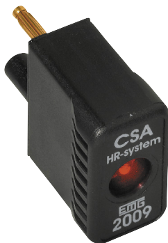
Bild 2 - Spannungsanzeiger Typ CSA

Zur vollen Funktionsprüfung kann das Gerät durch ein externes Prüfgerät überprüft werden. Die Wiederholungsprüfung ist gemäß den Vorschriften der Norm IEC 61243-5 (VDE 0682-415) durchzuführen.